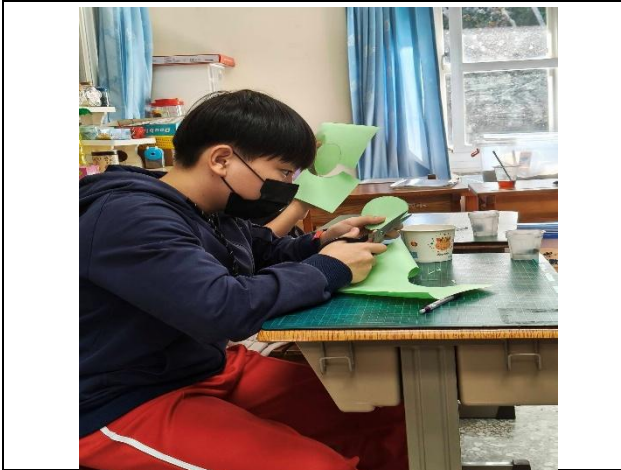
說明：兩位同學不利用圓規的情況下，畫出一個圓，並找出圓心、半徑和直徑