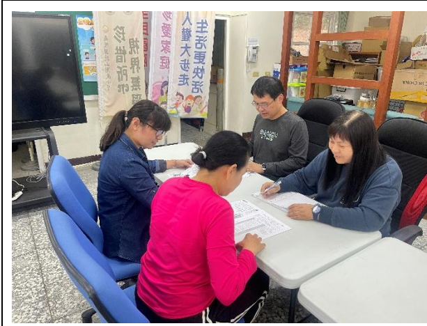
說明：說明課程編排想法