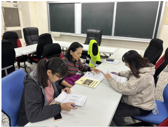
說明：說明課程設計理念