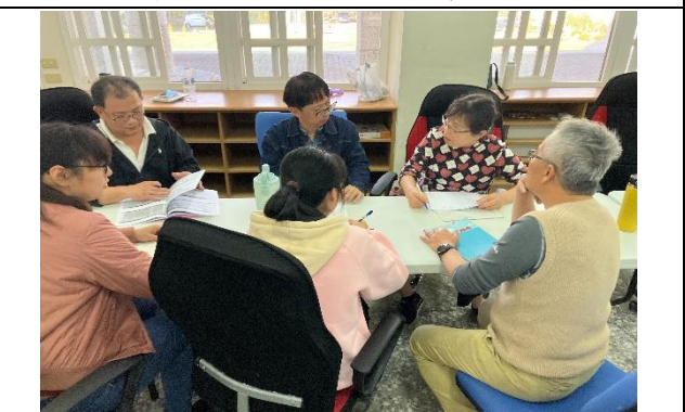
說明：關課後與同儕一起討論，聽取其他老師們對於公開授課的建議