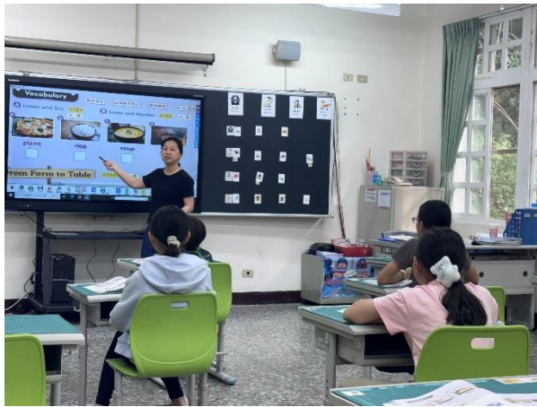
說明：觀課中－單字拼讀教學