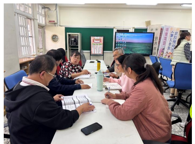
說明：教師分享觀課建議