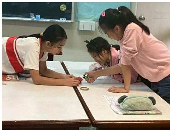
說明：學生做點蠟燭實驗