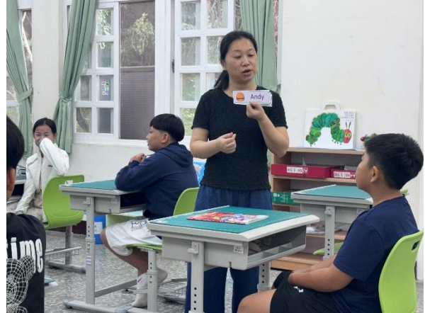
說明：觀課中一名字卡牌(新舊經驗連結)