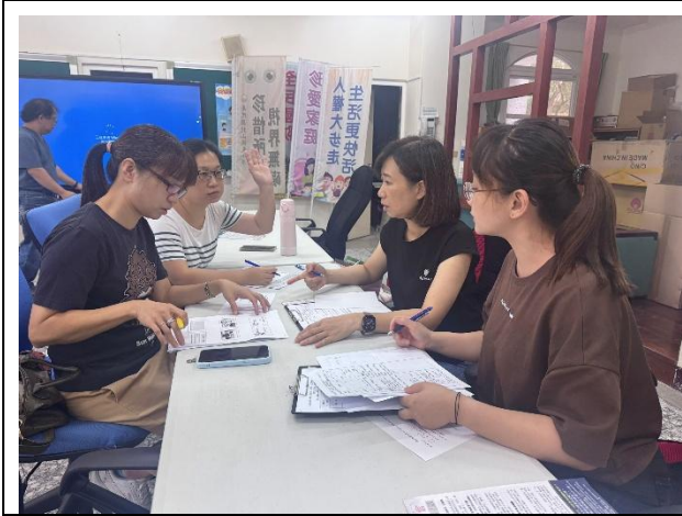
說明：觀課前-教案內容說明。