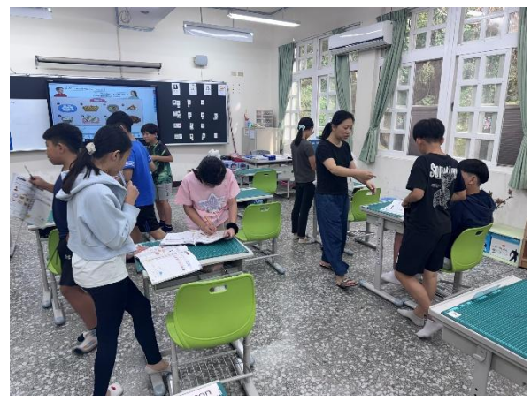
說明：觀課中－口語練習