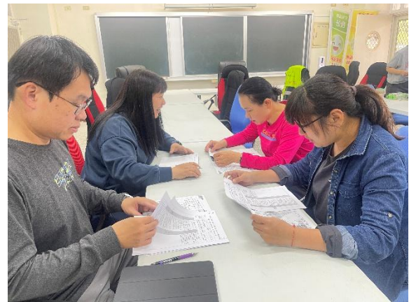
說明：回饋課程內容建議