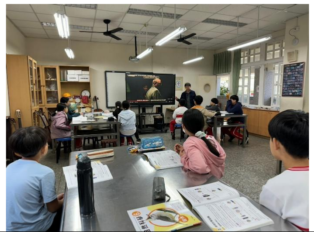
說明：影片中金屬與磁性的關聯討論