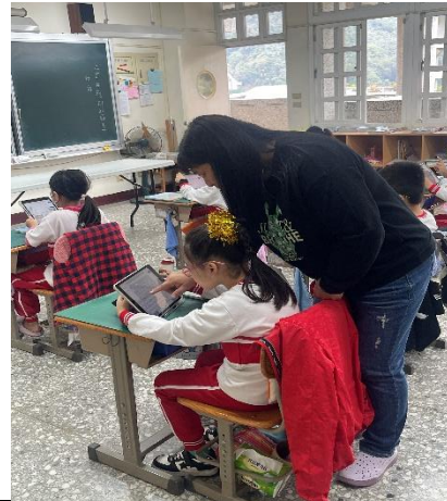
說明：老師協助孩子查詢相關訊息