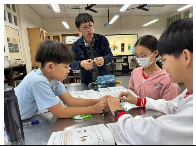
說明：討論指針與磁鐵偏轉的情況