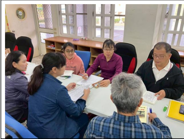
說明：授課前會議討論