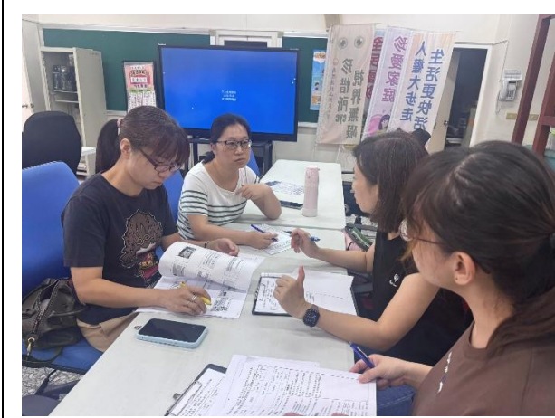
說明：觀課前-討論課程目標與流程，確定觀察焦點。