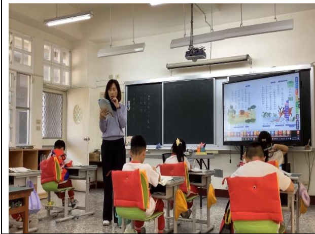
說明：觀課中-學生進行朗讀與口頭表達。