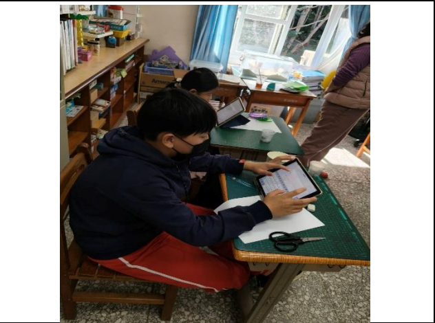
說明：觀賞圓形面積由來影片後，發派 google 表單呈現 5 個選擇題，讓學生作答，來了解學生是否真正看懂影片所要傳達的內容