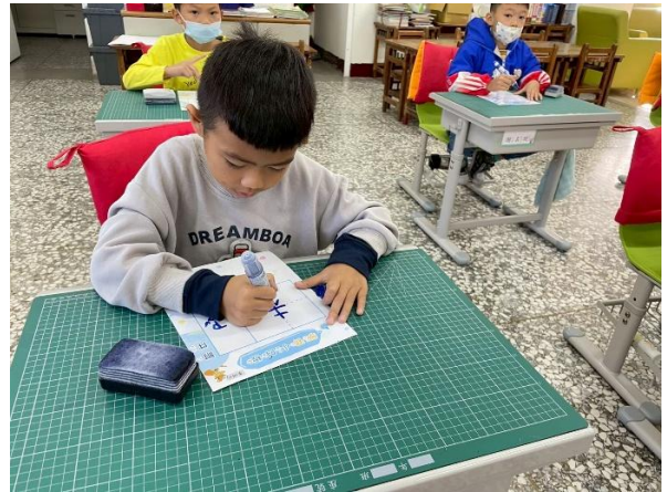
說明：觀課中-學生利用生字小白板進行書寫練習。