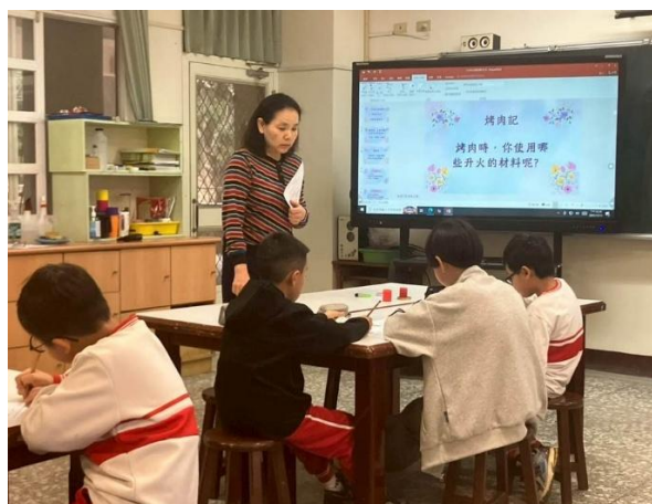
說明：老師巡視學生書寫學習單