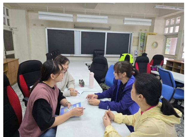
說明：觀課後－牌遊戲實作教師觀課心得回饋與交流