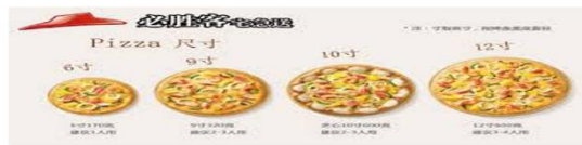
說明：透過生活中的買披薩經驗，教導學生披薩各種不同尺寸代表的意義以及面積的算法