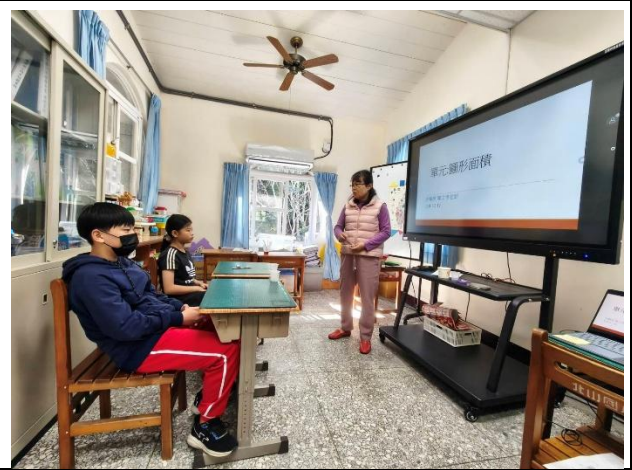
說明：老師介紹生活中有出現圓形的物品、建築物