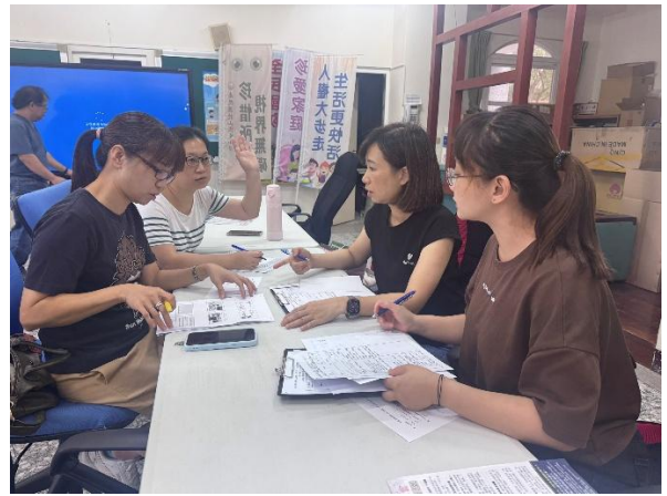
說明：觀課前-討論、分享課程設計的理念與目標。