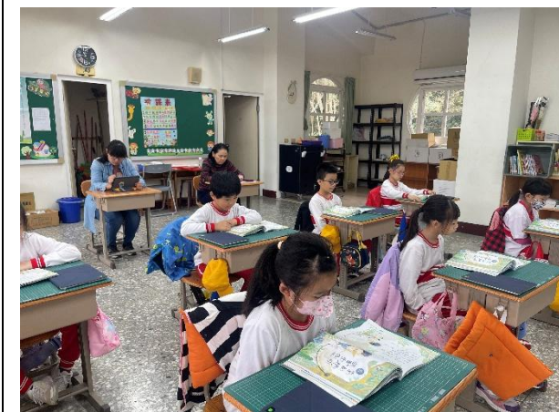
說明：朗讀課文內容