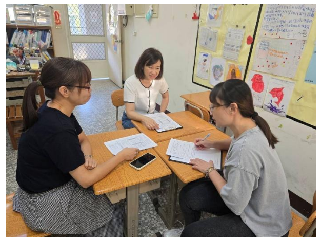
說明：觀課後-教師進行專業回饋與交流。