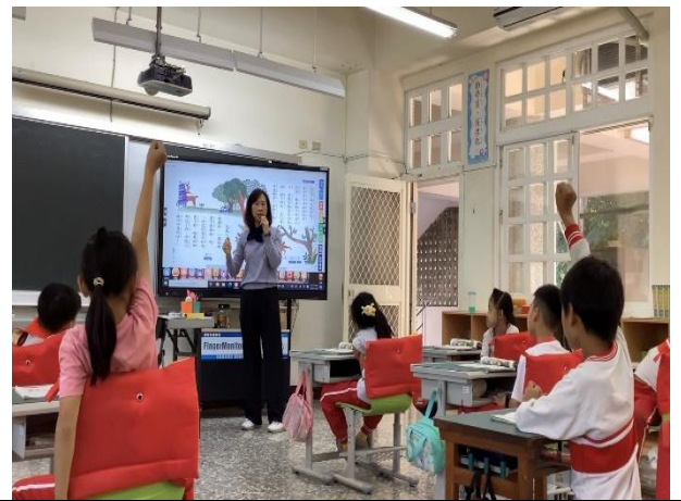
說明：觀課中-學生分享故事重點，表達個人理解。