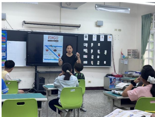
說明：觀課中－賓果遊戲