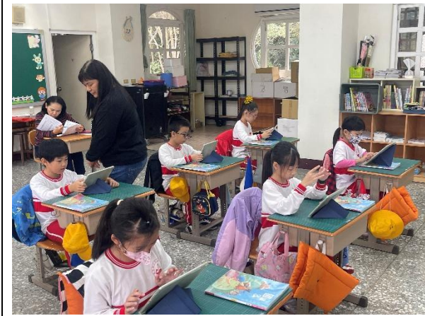
說明：孩子利用平板查詢醫生相關訊息