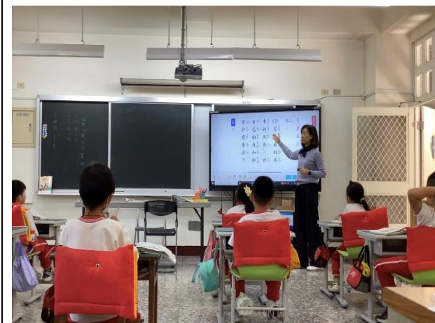
說明：觀課中-教師帶領統整課文主旨並進行回饋。