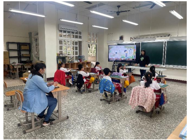
說明：老師講解課文課前問題探討