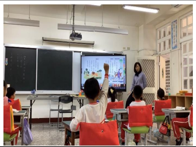
說明：觀課中-教師提問引導學生理解課文。