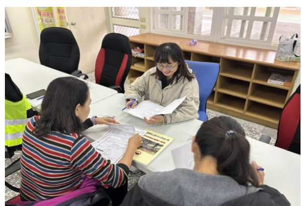
說明：回饋課程內容建議