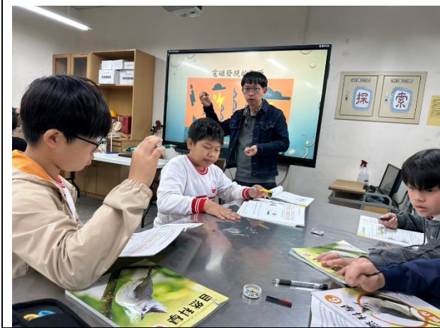
說明：分享電與磁的探討