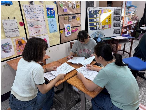
說明：觀課前一教案內容說明