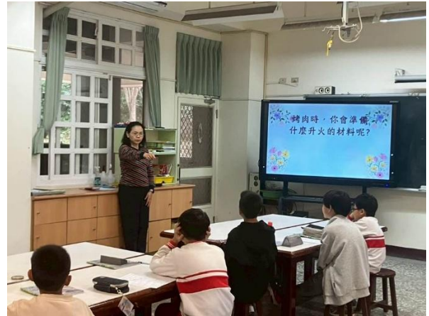
說明：老師提問:烤肉時準備的升火材料