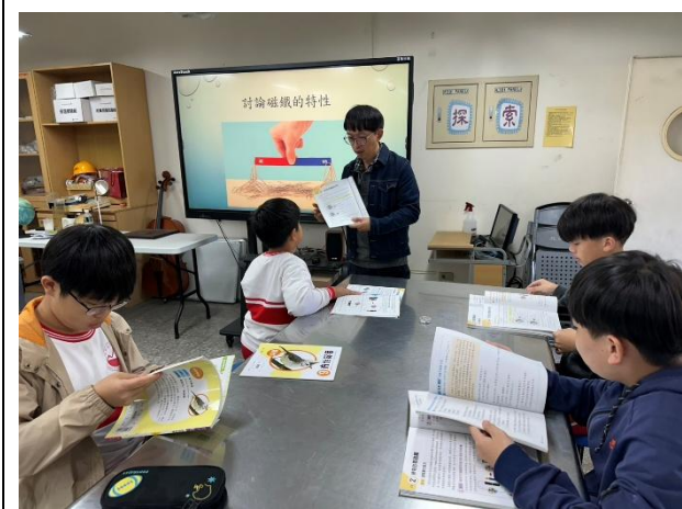
說明：討論磁鐵的特性及問題內容