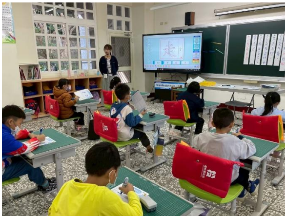
說明：觀課中-教師引導學生認識生字。