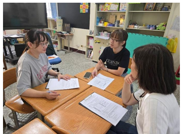
說明：討論學生表現與教學改進。