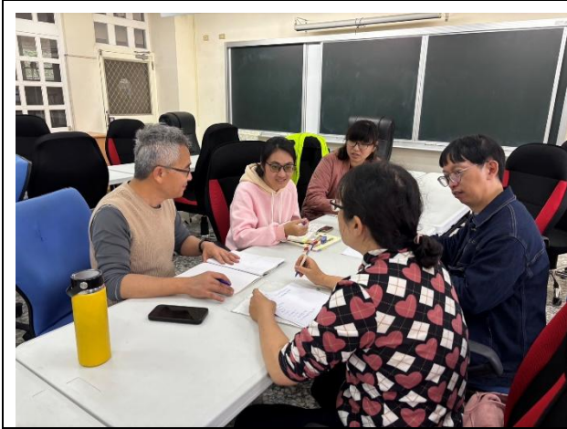
說明：討論教案設計的想法