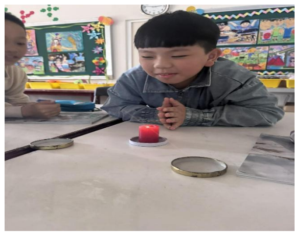
說明：專心觀察蠟燭