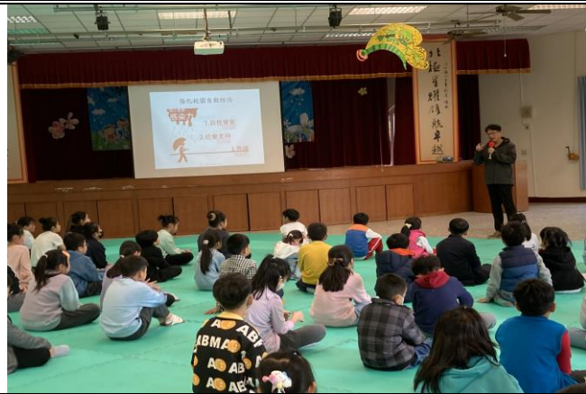
校長進行友善校園宣導(113. 2. 16)