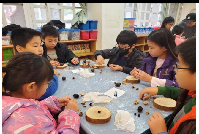
寒假冬令營手作種子活動(113. 2. 22)