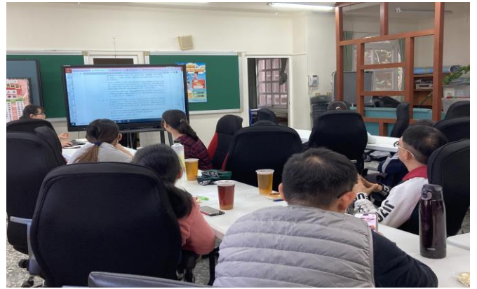
特教知能研習講座(113. 1. 3)