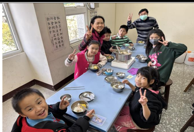
食農教育活動吃火鍋(113. 1. 26)