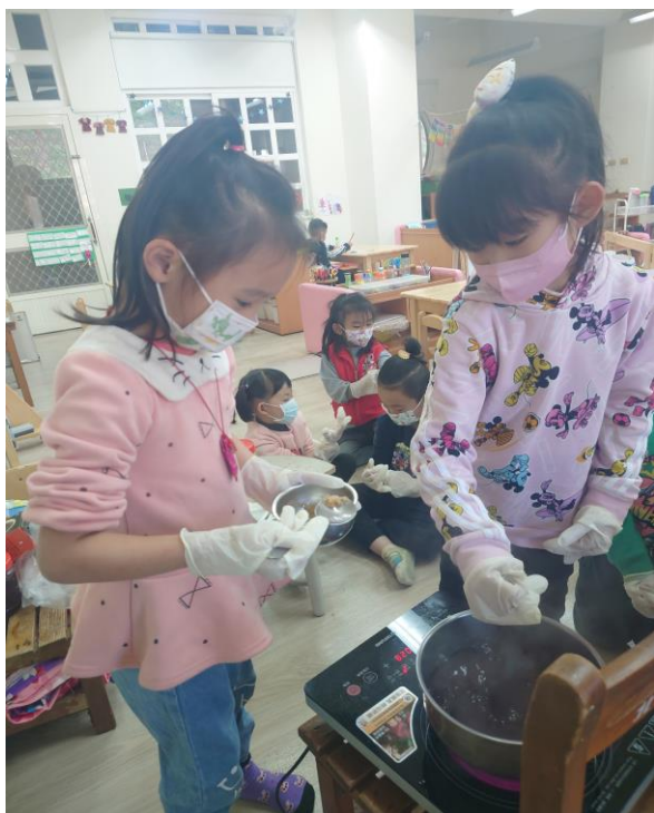
水鹿班學生練習熬製洛神花