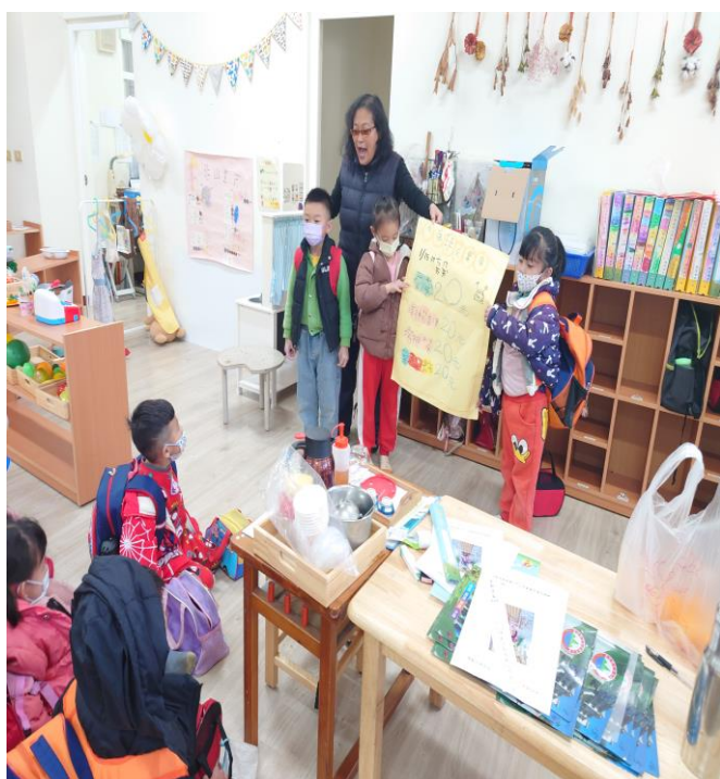
學生做販售商品海報價格表