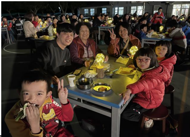
期末感恩餐會-親子同樂(113. 1. 18)