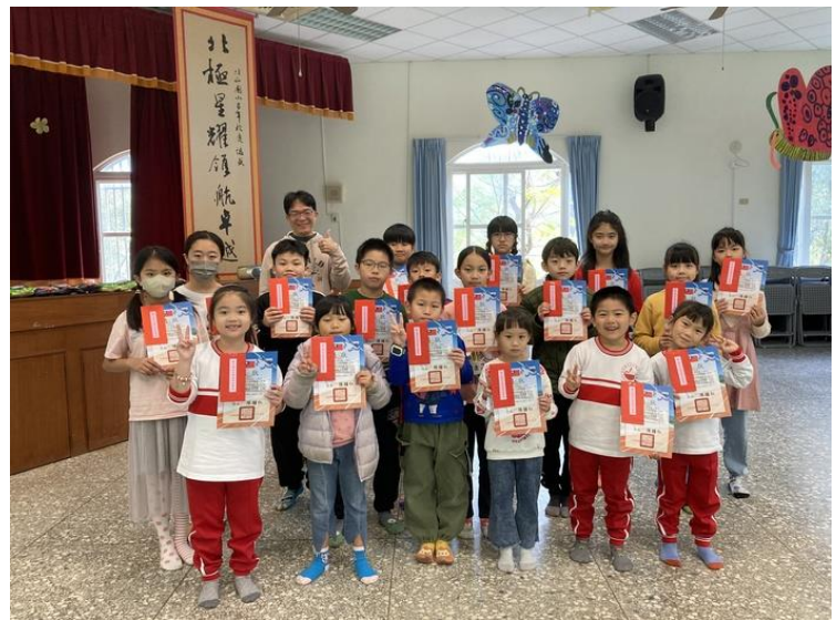
恭喜以上獲獎同學