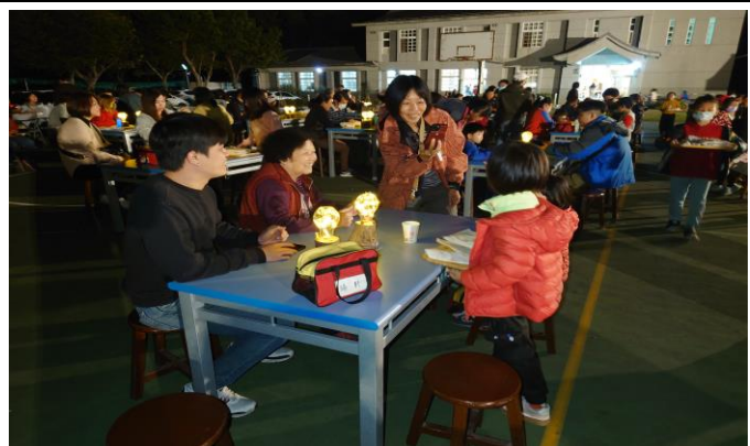
感恩餐桌上擺放學生自製燈泡照明(113. 1. 18)