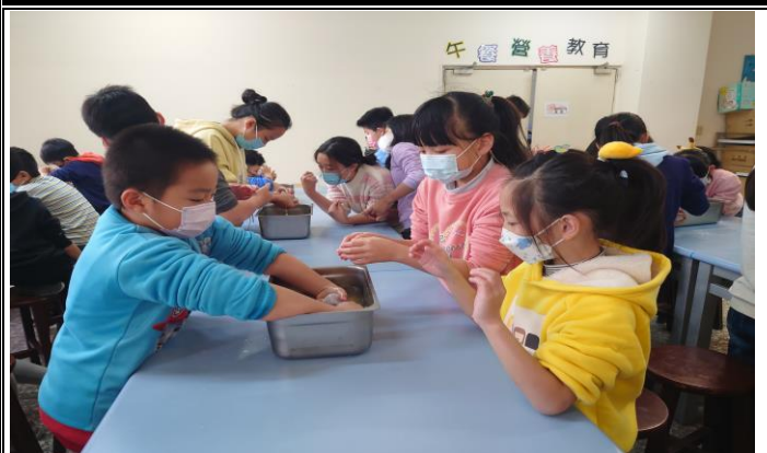
寒假冬令營-洗愛玉體驗活動 (113. 2. 23)