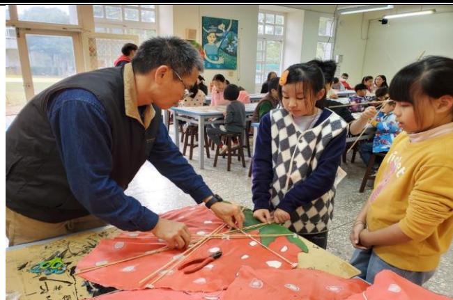
冬令營製作風箏(113. 2. 25)