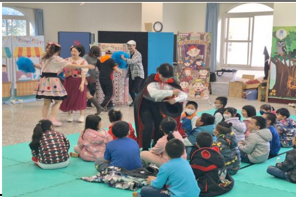
學生欣賞音樂劇表演(113. 1. 5)