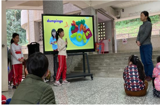
星期四晨間英語語文學習時光 (113. 1. 4)