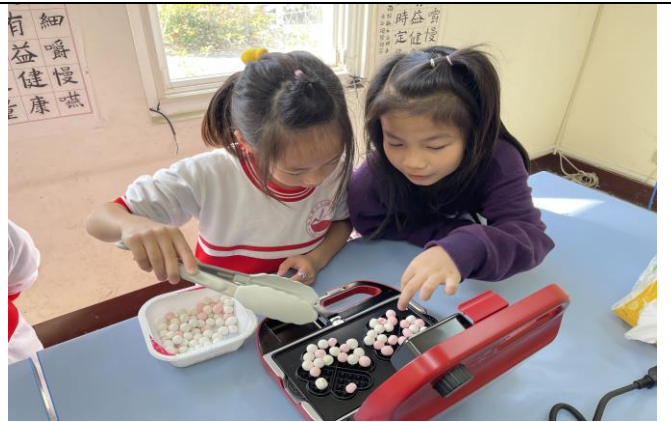
烘焙體驗教學(113. 1. 16)