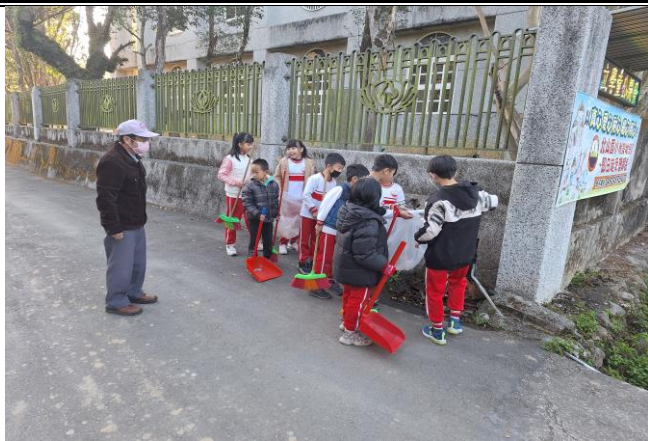
社區服務-清潔社區環境(113. 1. 15)